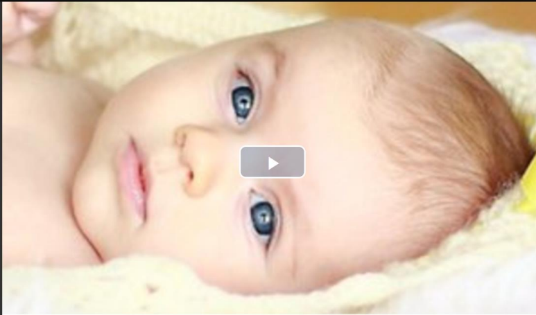
儿科护理学 拾莉 等